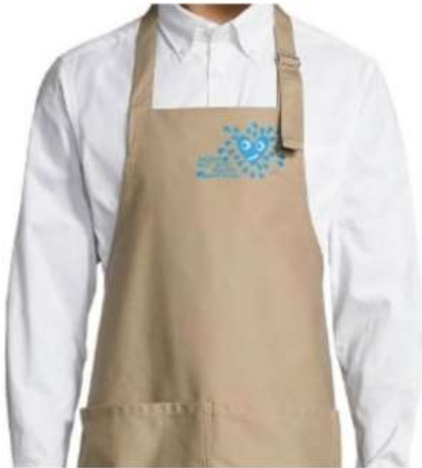
DELANTAL 15 EUROS