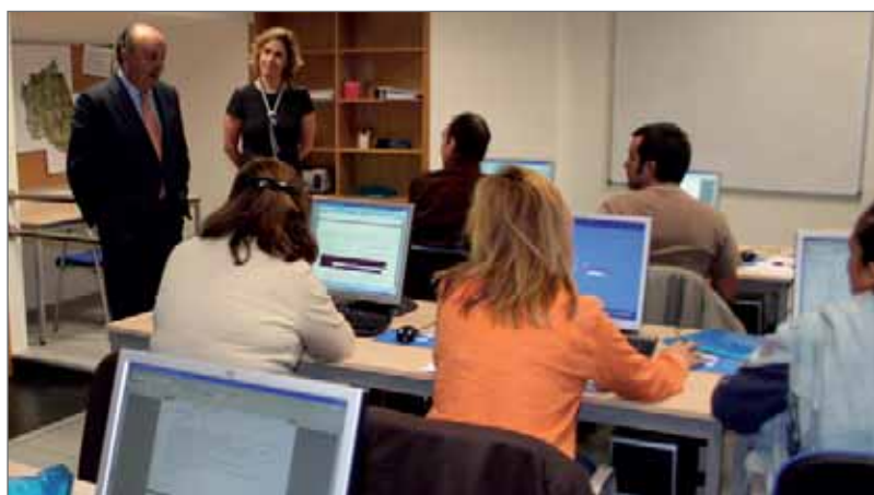
En la imagen superior y a la izquierda, una vista del nuevo centro; sobre estas líneas, el Alcalde y la Concejala de Economía saludan a los alumnos de uno de los cursos