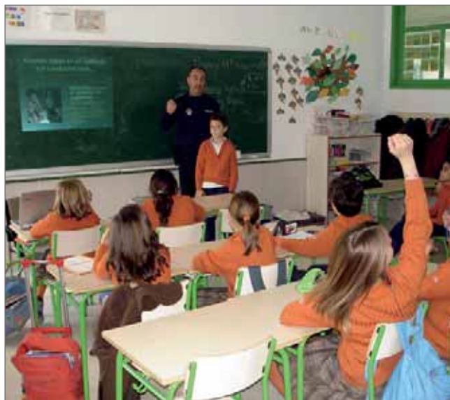
En la imagen, un agente imparte una clase teórica a alumnos de 5º de Primaria

Durante el curso se celebrará paralelamente un Certamen de cuentos cortos ilustrados sobre Educación Vial en el que también podrán colaborar padres y profesores.