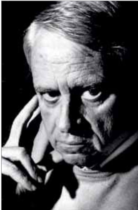
En la imagen, el compositor madrileño Cristóbal Halffter

El 8 de noviembre el Auditorio Joaquín Rodrigo acogerá el concierto de apertura del Concurso Internacional de Piano que, cercano ya a su década de vida, sigue acercando al público la obra de los compositores españoles.