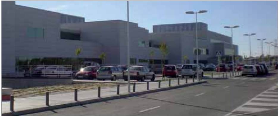
El nuevo servicio de autobuses unirá el municipio de Las Rozas con el Hospital Puerta de Hierro de Majadahonda

Desde los comienzos de los estudios de viabilidad y posterior proyecto los técnicos municipales han trabajado en el trazado, alternativas y posteriormente presentación de alegaciones municipales y estudio de las presentadas por particulares. El Ayuntamiento de Las Rozas había contado desde el principio con diferentes alternativas, entre las que se encontraba dar el servicio