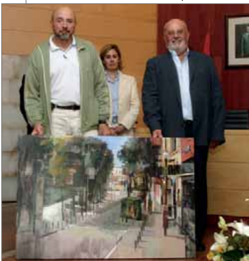
En la imagen, el ganador junto al Concejal de Urbanismo y Medio Ambiente; al fondo, la Concejal de Economía, Empleo, Agentes Sociales e Innovación