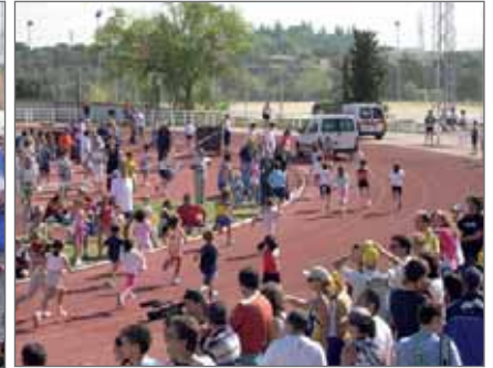
A la izquierda el pasado Memorial, sobre estas líneas la edición de 2008 de las Seis Millas

que Empresarial para celebrar esta prueba en la que se estará lo más granado del ciclismo profesional. En este caso, será el 29 de noviembre , a las 16 h. Se darán cita además de profesionales, las categorías sub-23, élite, ciclodeportista y máster.