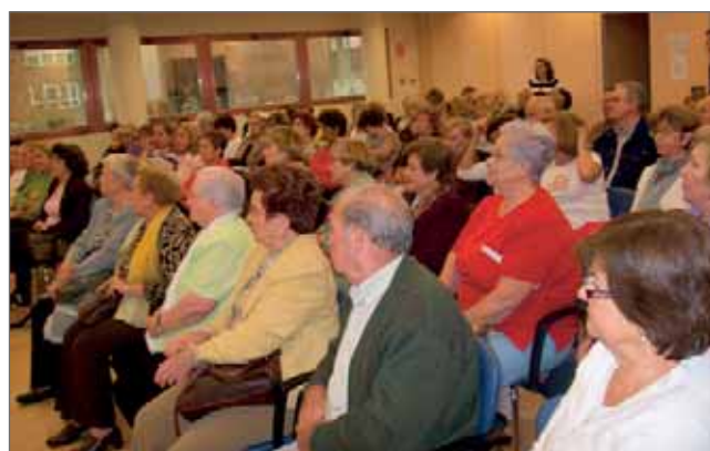
En la imagen, los participantes a esta primera sesión de la Escuela de Abuelos

Más información.- Concejalía de Menor y Familia C/ Kálamos 32. Tño.- 91 631 54 08.