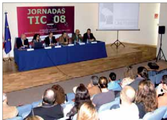
En la imagen, un momento de la celebración de las Jornadas

Los objetivos de esta jornada son: informar a las familias sobre los riesgos del uso inadecuado de las TIC's (Tecnologías de la Información y de la Comunicación), facilitar herramientas para que los hijos usen correctamente estas tecnologías, habilitar un espacio de participación y discusión sobre el tema y, además, conocer las actuaciones del Ayuntamiento en este campo.