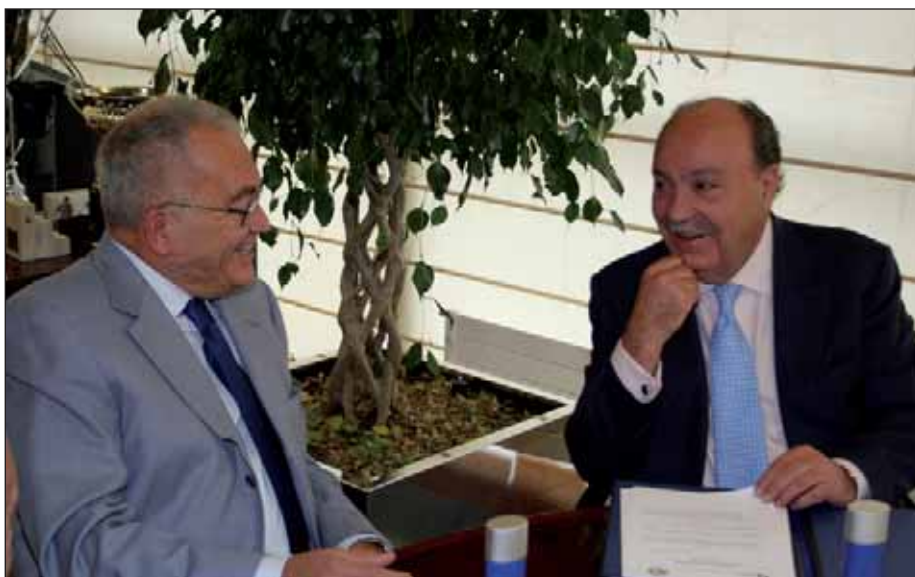
En la imagen, el Alcalde de Las Rozas charla con el Presidente de la Fundación AFIM durante la firma del convenio

ción del Minusválido) tiene una amplia experiencia, a nivel nacional, en la actuación con colectivos con dificultades de inserción. No sólo presta servicio a los discapacitados sino también a otros grupos, como mayores, parados, jóvenes menores de 25 años, mujeres e inmigrantes.