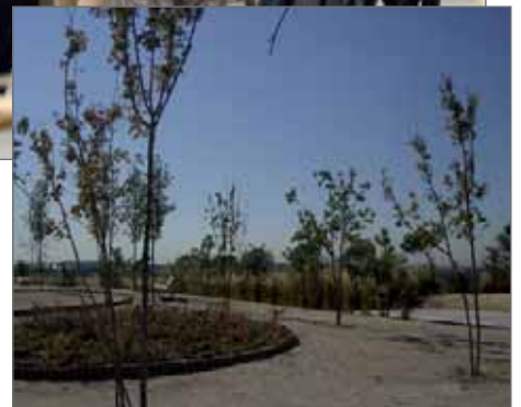
Sobre estas líneas, un momento del paseo inaugural y una vista general del nuevo parque

por alcornoques, pinos y cipreses y enmarcadas por muros de piedra natural. En toda la zona que se han utilizado gran cantidad de especies de gramíneas siguiendo un modelo de xerojardinería. Se ha creado un espacio modelo de jardinería sostenible , que servirá de nexo entre la Dehesa de Navalcarbón y el núcleo urbano.