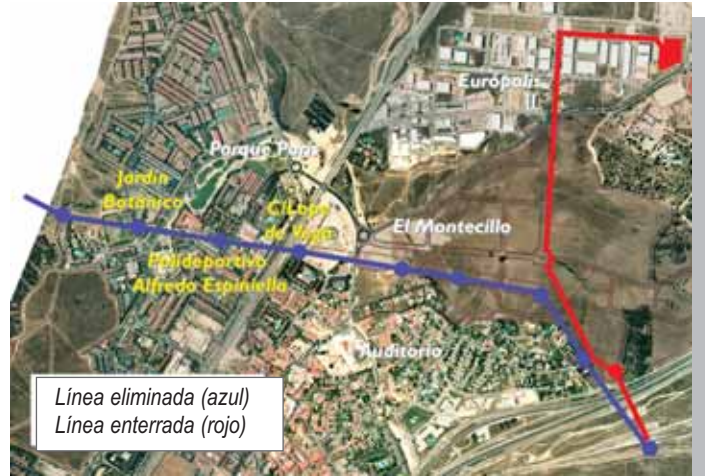
Línea eliminada (azul) Línea enterrada (rojo)

La antigua Iglesia de San José, en Las Matas, -actualmente desacralizada-, será objeto en este año de un proyecto de rehabilitación y adaptación para albergar el Museo Ferroviario de Las Rozas. Se prevé un plazo de 6 meses para las finalización de las citadas obras.