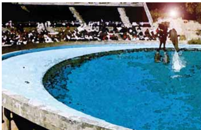
Las actividades finalizan con una exhibición en el delfinario.

La celebración del Día del Árbol es una magnífica ocasión para concienciar a los más pequeños sobre la importancia del respeto al medio ambiente.