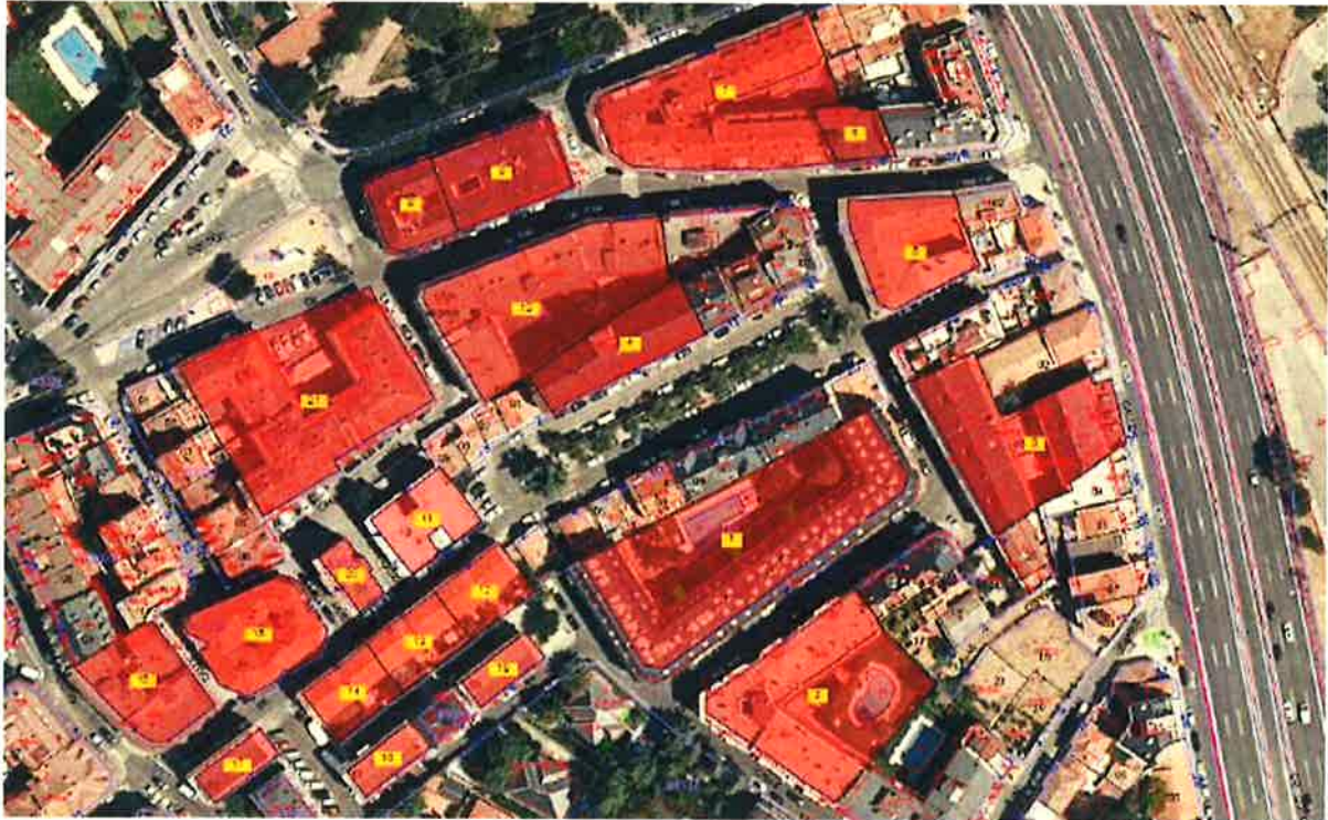
ERRP “Barrio de la Suiza”.