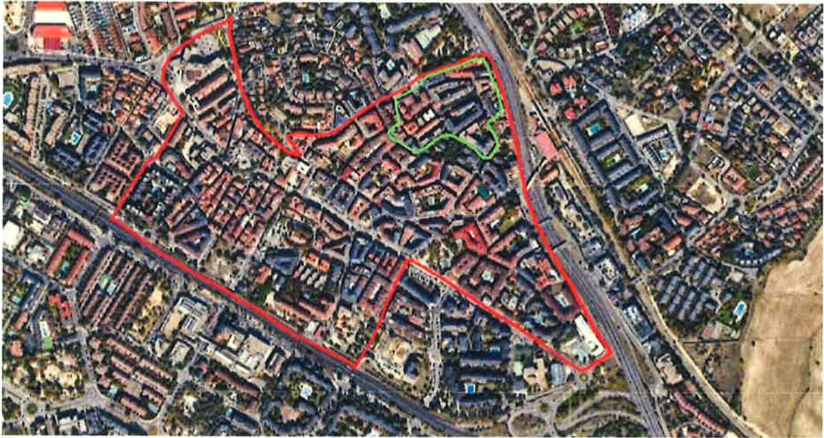
Localización del ERRP “Barrio de la Suiza” en el municipio de Las Rozas de Madrid.