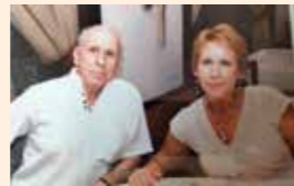
PADRINOS DE LAS FIESTAS DE SAN JOSÉ 2024

* Normas completas publicadas en la web municipal: www.lasrozas.es